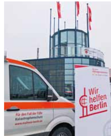
2021: Berlins zweitgrößtes Impfzentrum im Kampf gegen Corona wird von den Maltesern betreut.