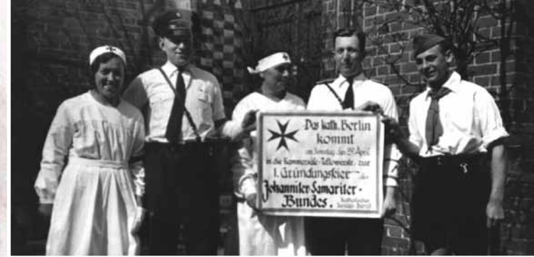
In Berlin wurde bereits 1933 der Johanniter-Samariter-Bund, ein katholischer Sanitätsdienst gegründet, der 1956 geschlossen in den Malteser Hilfsdienst übertrat.