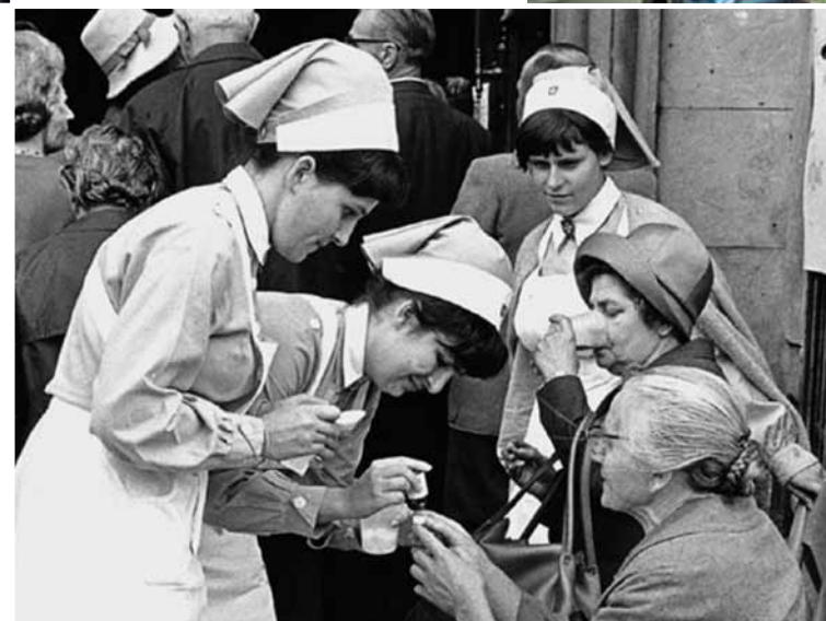
1965: Die Malteser Schwesternschaft wird offiziell gegründet. Doch schon Berichte aus dem 11. Jahrhundert erzählen von den Schwestern der Hospitalbruderschaft, die sich der Pflege kranker Frauen widmen.