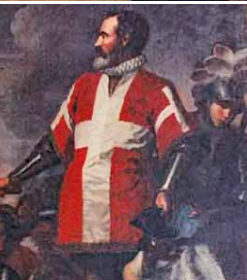
Schon seit Jahrhunderten steht der soziale und medizinische Einsatz unter dem Emblem des Ritterordens mit dem weißen Kreuz.