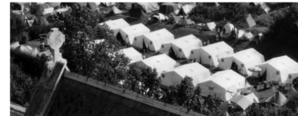
1989: Hilfe für die DDR-Flüchtlinge in Budapest