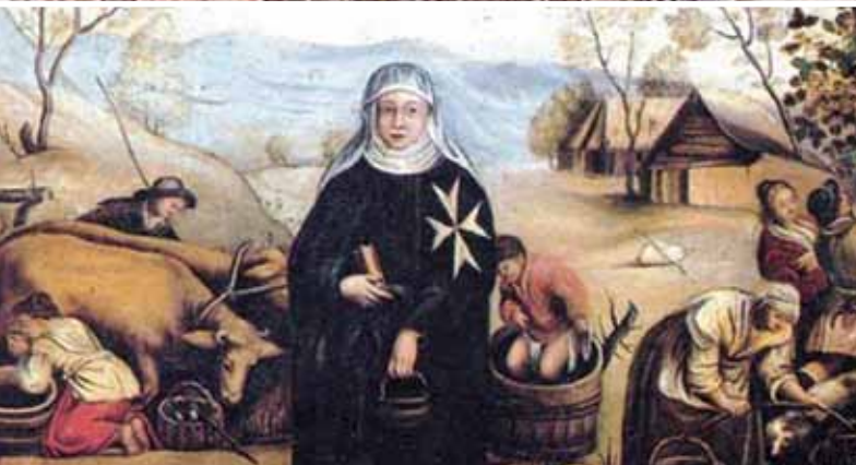
1048: Der „Souveräne Ritter- und Hospitalorden vom heiligen Johannes zu Jerusalem von Rhodos und Malta“ gewährte in einem Hospital in Jerusalem Pilgern erstmals Schutz, Obdach und medizinische Betreuung – unabhängig von deren Glauben oder Herkunft.