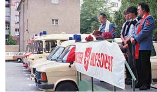
1986: Einweihung der neuen Diözesangeschäftsstelle in der Alten Feuerwache in Berlin Charlottenburg