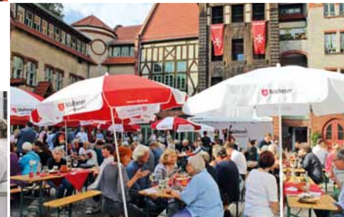
2018: Die Malteser feiern 85 Jahre ihres Wirkens im Erzbistum Berlin.