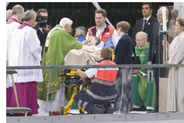
Sanitätsdienst bei Berliner Mega-Events: 1999 Love Parade und 2011 Papstbesuch